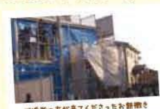
ご近所の方が集ってくださった餅撒き

棟上げと地鎮祭ですね。中でも棟上げは餅撒きをしまして、ご近 所の方をはじめたくさんのかたにおいでいただきましたのでとても いい思い出になりました。