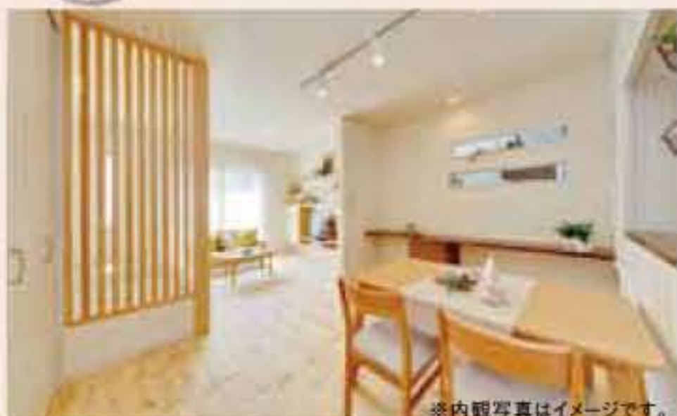
※内観写真はイメージです。